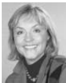
Staatsministerin Dr. Beate Merk