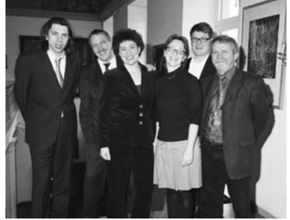
Für schwingvolle und kurzweilige Unterhaltung sorgte das eigens engagierte "Stuttgarter Juristen-Kabarett"