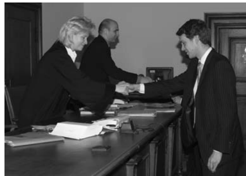
... die Richter gratulieren.