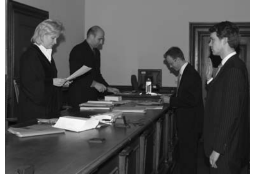
Die jungen Anwälte legen Ihren Eid ab ...