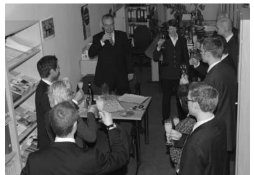
Im Anschluss gibt es einen Sektempfang im Anwalt-Service-Center - mit dabei auch die Vertreter der Kammer